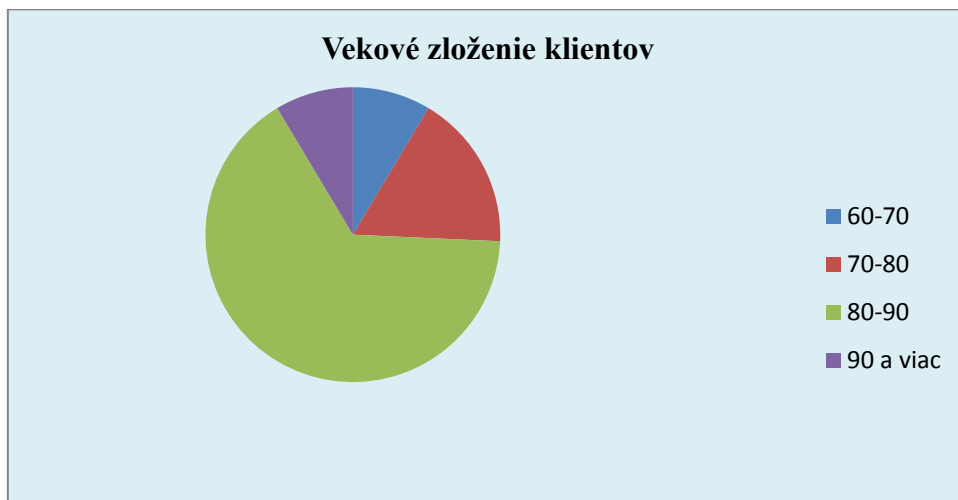
Graf. č. 2: Vekové zloženie prijímateľov sociálnej služby k 31.12.2018.